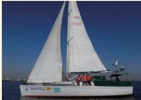
協力艇：サザンクロス号 (40ft)