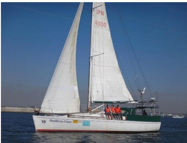
協力艇：ヨット・サザンクロス号(40ft)

11月 3日(日) 12時 東京夢の島マリーナ入港予定～酒問屋の守護神 新川大神宮 (伊丹諸白を奉納)